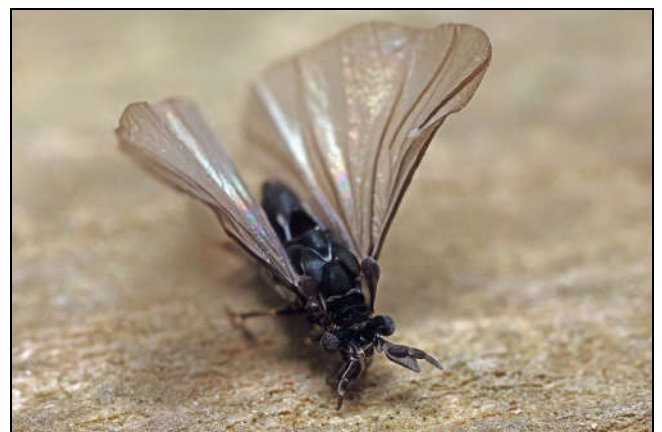
Figuur 4: mannetje Stylops ater (zandbijwaaiertje)

Mannetjes van deze waaier vleugeligen leven slechts enkele uren. Ze zijn circa 3 mm lang (vrouwtjes 10 mm). Ook bij mannetjes (popvorm) steekt een deel van de pop uit tussen de tergieten van de waardbij. Door de werking van het zonlicht worden de mannetjes gestimuleerd om uit te sluipen. De Stylops vrouwtjes scheiden feromonen af om aan de mannetjes door te geven dat ze paringsbereid zijn. De planning komt vrij nauw, want de mannetjes leven immers erg kort en moeten in die tijd een vrouwtje vinden en het bevruchten. Ze hebben daartoe zeer gevoelige antennen met een typische vorm: de antennesegmenten spruiten voort uit een soort langwerpige schildje (fig. 3 en 4), waardoor geurstoffen via reflectie vermoedelijk nog beter gelokaliseerd kunnen worden. De antennen hebben zeer gevoelige chemoreceptoren.