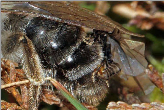
Figuur 6: copulerend mannetje Stylops ater

De facetogen zijn relatief groot en zullen waarschijnlijk dienst doen in het dichtbijgebied van de waardbij waarop het Stylops vrouwtje zich bevindt. Het bijzondere van de Stylops sogen is dat ieder facet in wezen een enkelvoudig oog is met een eigen netvlies. Zo worden een aantal deelbeelden gemaakt die omgezet worden tot een totaalbeeld. Bij normale facetogen worden alle beelden samen op één netvlies verzameld.