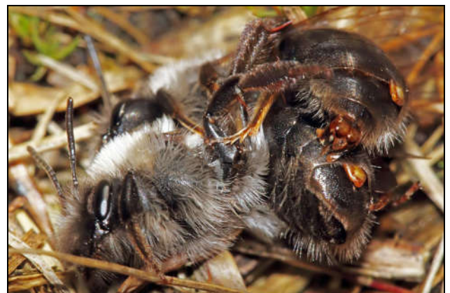
Figuur 7: parende Andrena's vaga , beide met een Stylops

Geraadpleegd: John T. Smit & Jan Smit, De waaivleugeligen ( Strepsiptera ) van Nederland (2005)