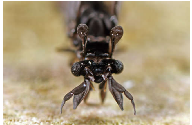
Figuur 3: mannetje Stylops ater (zandbijwaaiertje)

De voorvleugels zijn geëvolueerd tot stompjes (ook wel: haltertjes) zoals de vliegen ( Diptera ) die kennen van de achtervleugels. Bij deze soort is de vorm wat platter (fig. 3).