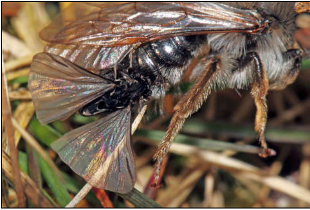
Figuur 5: copulerend mannetje Stylops ater