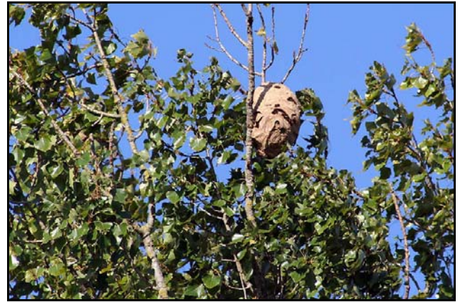
Figuur 5: hoornaarnest in populier ( V. velutina )

De larven van deze en alle verwante wespensoorten krijgen uitsluitend dierlijke eiwitten te eten. Dat zijn dikwijls delen van insecten: het borststuk, waarin alle spieren zich bevinden. De rest van het insect wordt niet gebruikt. Het voedsel voor de larven kan ook bestaan uit vlees van zoogdieren of vogels en dan liefst van verse kadavers.