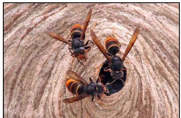
Figuur 6: wakers bij de nestingang ( V. velutina )

De larven (fig. 7) zijn voor de volwassen hoornaars ook belangrijk als voedselbron. Ze scheiden een suikerrijk afvalproduct af dat tevens voorzien is van diverse andere stoffen, die het tot een compleet voedsel maken voor de adulte dieren. Zodra dit aanbod door krimp van het broednest in het najaar terugloopt, gaan wespen op zoek naar andere suikerbronnen zoals nectar van bloemen en suikers van vruchten, die ze dan aanvreten en zo flink wat schade kunnen veroorzaken. De Oosterse hoornaar rooft ook graag honing uit bijenkasten en bij massale aanvallen kan de gehele kast geplunderd worden. Om die reden zetten imkers wel roosters voor de vliegopening, zoals op figuur 8 nog net te zien is.