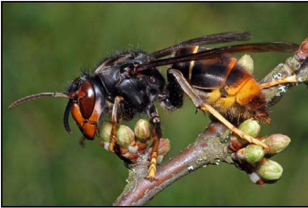
Figuur 4: werkster Vespa velutina

Vooralsnog wordt de Aziatische hoornaar in Europa alleen in Frankrijk gevonden, maar de opmars naar het noorden lijkt begonnen.