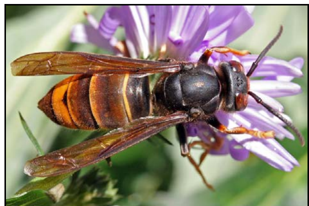
Figuur 3: werkster Vespa velutina