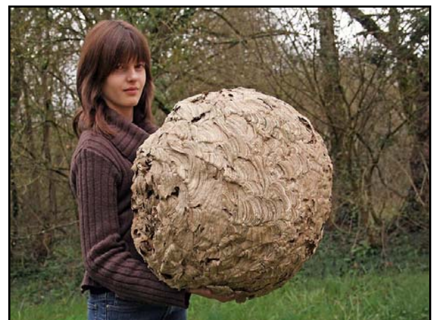
Figuur 9: bolvormig hoornaarnest ( V. velutina )

Gepubliceerd in het Maandblad van de Vlaamse Imkersbond in maart 2011.