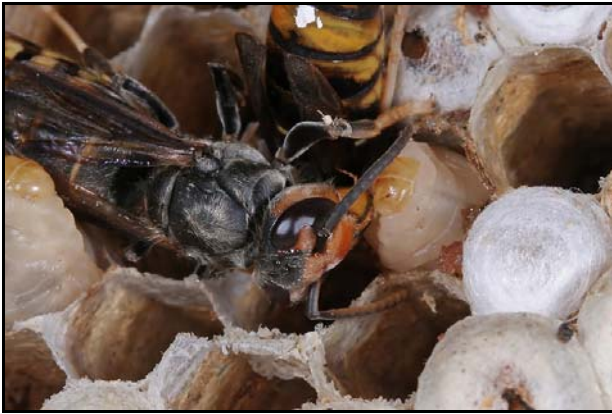
Figuur 7: verzorging van larven ( V. velutina )

Als er honingbijenvolken in de buurt leven, zijn die een gemakkelijke prooi en in korte tijd kunnen de hoornaars een volledig volk decimeren. Ze kunnen tot wel 5000 exemplaren per dag wegvangen.