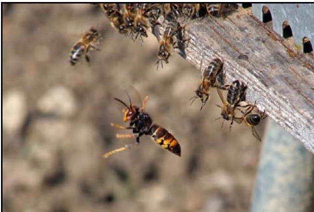
Figuur 8: jagende Aziat. hoornaar voor bijenkast

Als er honingbijenvolken in de buurt leven, zijn die een gemakkelijke prooi en in korte tijd kunnen de hoornaars een volledig volk decimeren. Ze kunnen tot wel 5000 exemplaren per dag wegvangen.