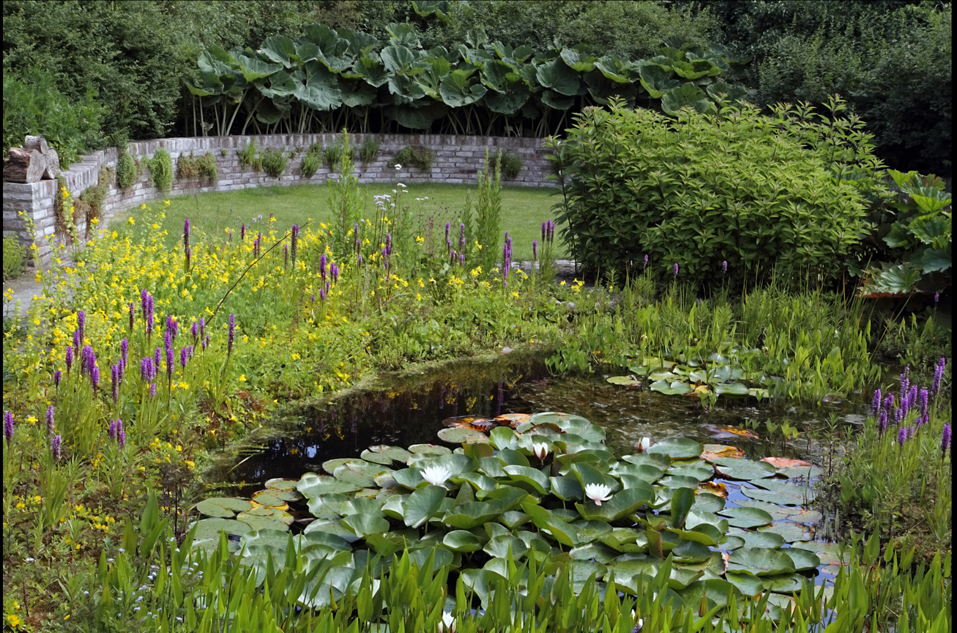
Vijver omstreeks half juni.