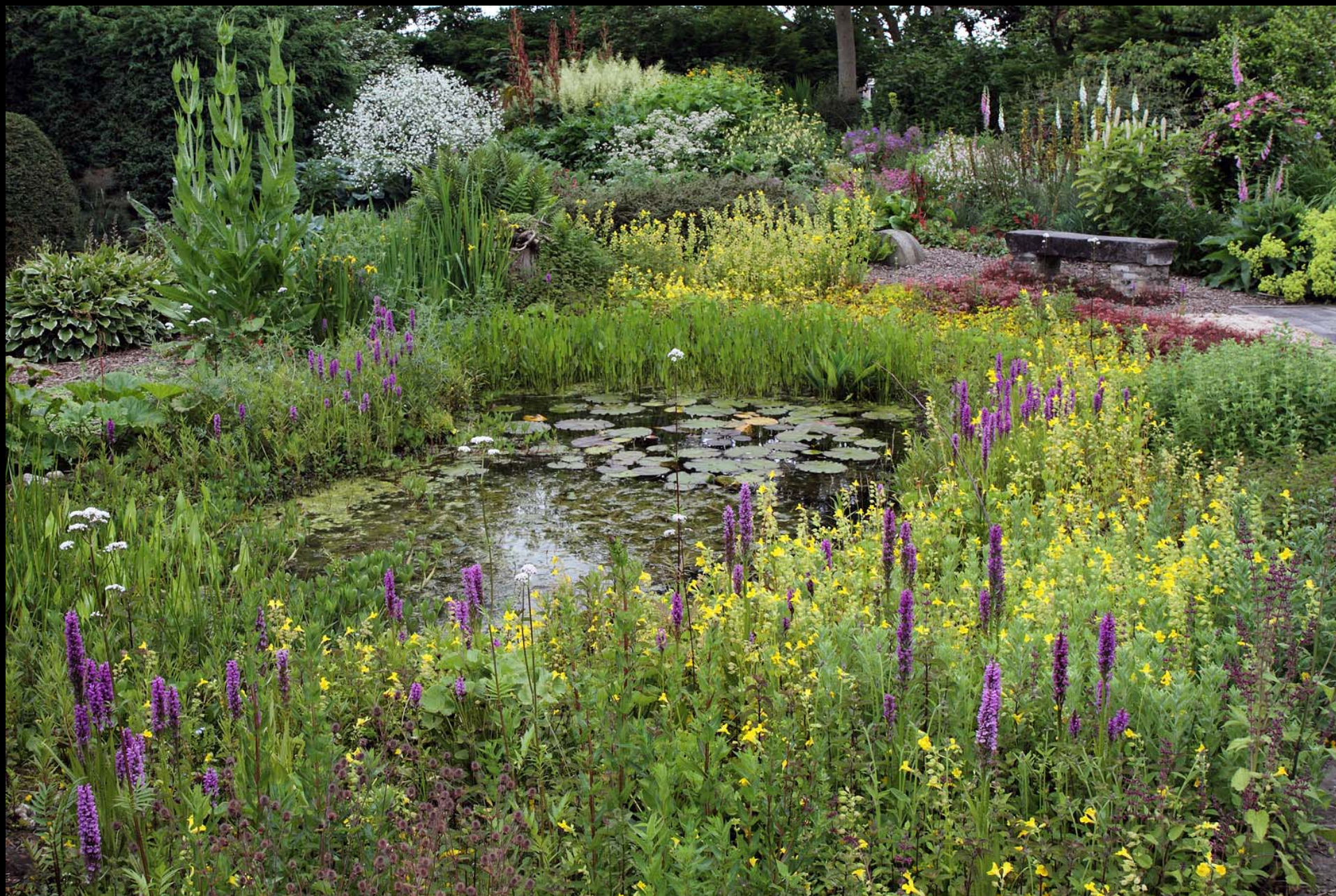
Vijver omstreeks 1 juli.