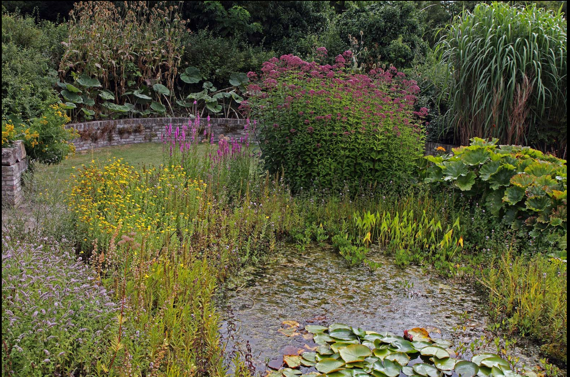
Vijver omstreeks 20 augustus.